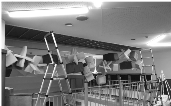
天井から吊るした吸音材の例

『環境音下における幼児の選択的聴取の発達』、嶋田容子・志村洋子・小西行郎 (2018)、日本音響学会誌, 74 (3), 112-117.