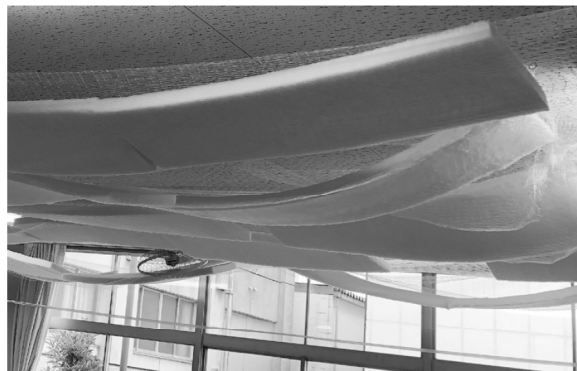
天井にネットを張ってその上に、吸音材を置いた例

いてくるトラックやバイクの音が聞こえます。子どもたちには「なんて言ったでしょう?」「なんの音でしょう?」とクイズを出し、イラストを指さしたり口で話したりしながら、答えやすい形で答えてもらいました。すると、雑音の中で先生の言葉やトラック等の音の間違えず答えた子の割合は4歳ではとても低く、6歳では統計的にも明らかに高くなったことがわかりました。(上図) Maxwell *1 らの研究では、吸音措置をした保育室の子どもは、しなかった保育室の子どもより1年後の言葉の伸びが大きかっただけでなく、諦めず取り組み力が大きかったことが報告されました。また、文字認識など認知的な処理に差が出たことも示されています。小学生ではより多くの研究があり、様々な発達との側面に音環境が影響を及ぼすことを示唆しています。(Traversini *2 らのレビューを参照) 赤ちゃんの暮