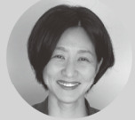
執筆 嶋田容子 (同志社大学)

赤ちゃん学の基礎研究から、子どもたちをさらに深く理解するヒントを探してみましょう。毎月、それぞれのテーマを専門とする先生方に交替でご執筆いただきます。