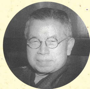
倉橋惣三 (くらはし そうぞう)

日本のフレーベルと呼ばれた倉橋惣三は1882年に誕生し、今年で生誕140年になります。フリードリッヒ・フレーベルに憧れ、日本の子どもたちの育ちのために尽力した倉橋惣三の現在にもつながる幼児教育への想いを、人生の歩みとともにたどりませう。