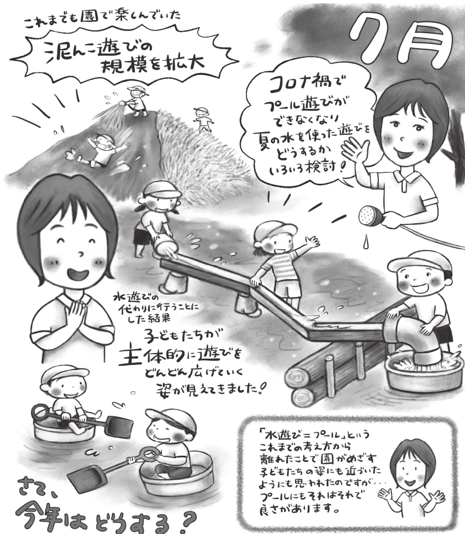
イラスト●近藤えり