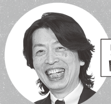
監修・聞き手 桑戸真二 (フレーベル館 保育経営アドバイザー)