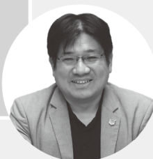
執筆 脇 貴志 (株式会社アイギス)

【バイアス】にも様々なものがあります。自分に都合の良い情報ばかり集める「確認バイアス」。自分に都合の悪い情報を無視してしまう「正常性バイアス」。実際の評価と自己評価を正しく認識できず、誤った認識で自身を過大評価してしまう「ダニングクルーガー効果」などです。要するに、人は自分の見たいように物事を見て、自分に都合が良いように聞き、自分勝手な解釈をするものだ、ということなのです。でも、何も考えないまま