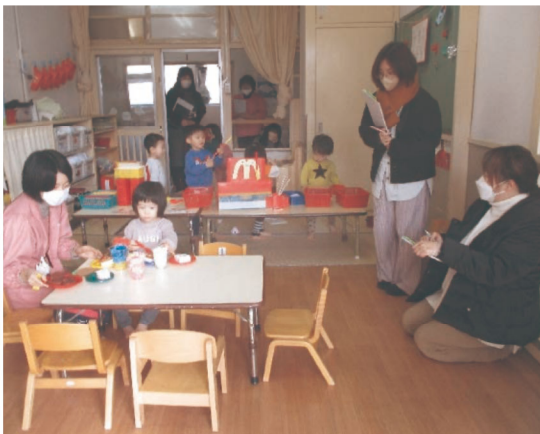
※写真は他園での公開保育の様子