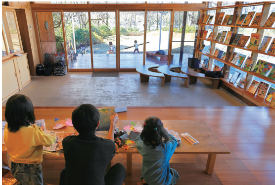
ガラス張りの保育室。保育室から見ると、小上がり-土間-デッキ-庭とシームレスにつながっています。建築デザインが機能していますね

保育室はガラス張りで、子どもたちはどこで何をしてもいい。室内の遊びも外の遊びも、視覚で認識できますから、子どもが全部自分で選べて決められます。