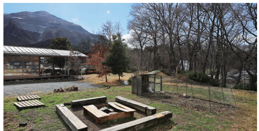
庭で果樹の実を摘み、たき火に集い、山の姿に季節を思う。抜群に魅力的な自然環境です。この日は鶏が卵を産んでいました