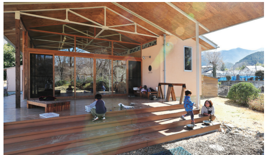
デッキで絵具遊びが始まりました。雨の日の遊び場にも。屋根は、大屋根と呼んでいいほど大きく、「アウトドアリビング」ですね