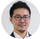
執筆 浅井拓久也 (鎌倉女子大学)

固定観念や慣習化などによって、当たり前になっていることはありませんか。職員の業務や保育行事を見直したいと思った時どうすればよいか、リフレーミングのための思考法を紹介します。